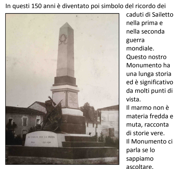
Il Monumento ai Caduti di Sailetto nel 1926

A ricordare gli eventi del 1866 oltre al forte Magnaguti di Borgoforte e ai resti del forte Noyeau di Motteggiana troviamo il Monumento ai Caduti di Sailetto. "Un obelisco fu eretto per volere dei Sailettani per ricordare gli eventi del 1866" ma soprattutto per dare adeguata sepoltura alle spoglie mortali dei militari deceduti nella battaglia del 5-17 luglio, inizialmente sepolti nelle campagne circostanti e successivamente raccolti e traslati nel Monumento. Fu inaugurato nel novembre del 1887, contribuirono economicamente alla sua realizzazione i Comuni di Borgoforte, Motteggiana e Suzzara "col fraterno aiuto di oblatori di ogni parte d'Italia". E' una rara testimonianza di carattere risorgimentale nel nostro territorio. Nel 1926 fu ampliato e spostato nella posizione attuale con l'aggiunta di un Viale delle Rimembranze, ripristinato di recente nel 2014, dove ogni pianta rappresentava un soldato caduto.